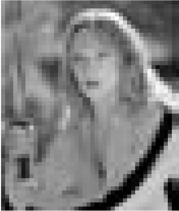
La vengeance d'une tueuse à gages ... Uma Thurman dans "Kill Bill: Volume 1" de Quentin Tarantino. Nouveau à l'Utopolis (Luxembourg) et à l'Ariston (Esch/Alzette).