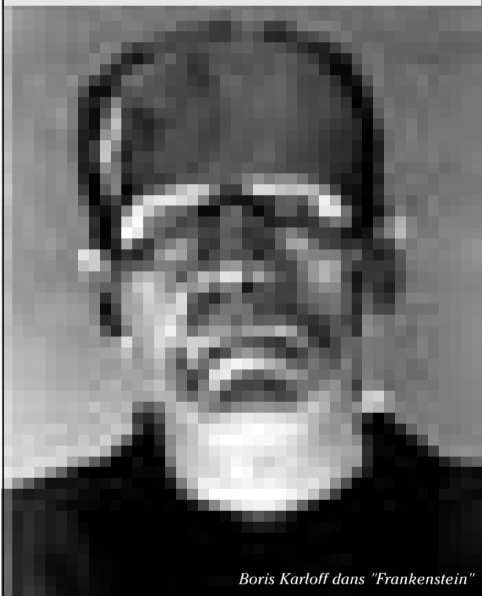
Boris Karloff dans "Frankenstein"