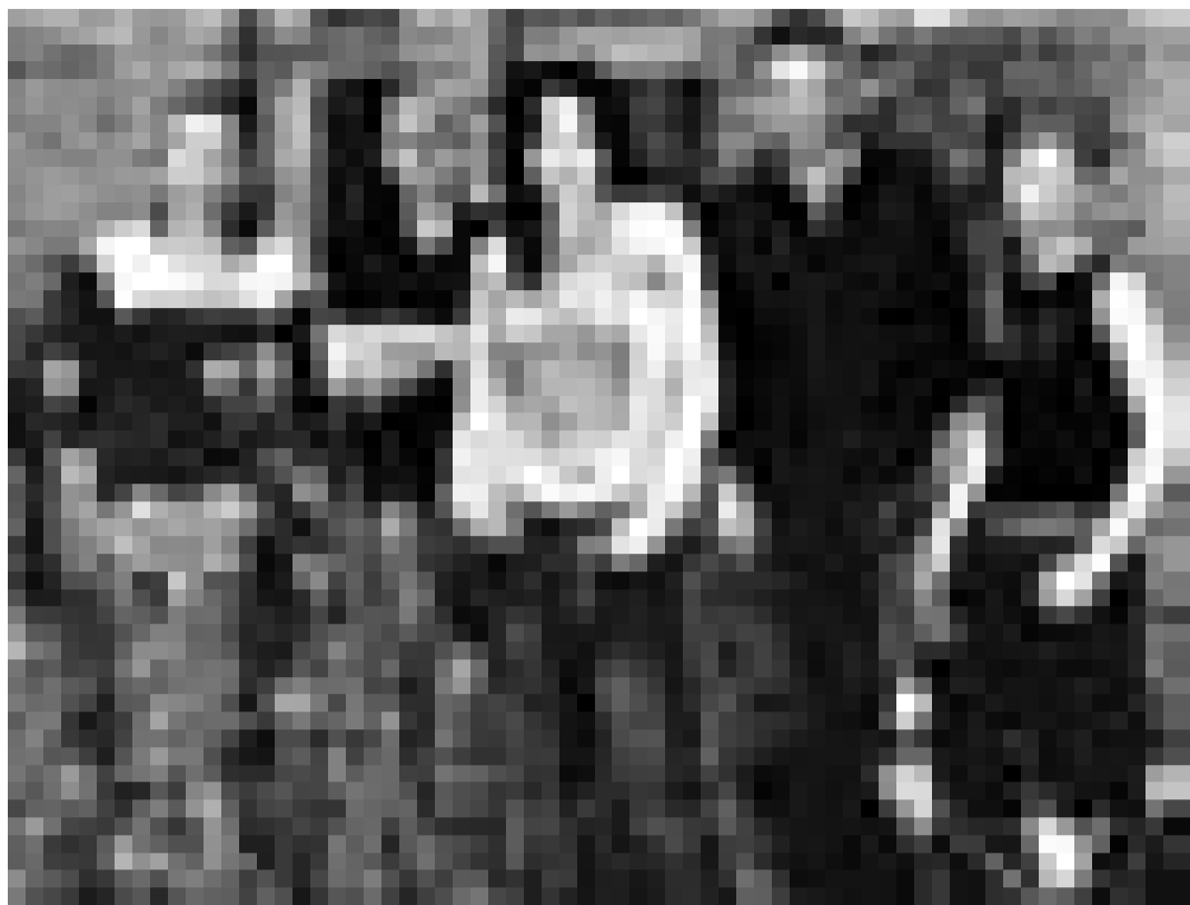
"Frauenpower im Rockgewandt" ... Das Emergenza-Team gibt sich eine weibliche Note mit dem Konzert von "Moff" (Foto) und "Couchgrass" im "Plain Vanilla", Kockelscheuer, am 8. November.

Mia-Münster-Haus, St. Wendel , 17h30. Tel. 0049 6581 8 09-1 36.