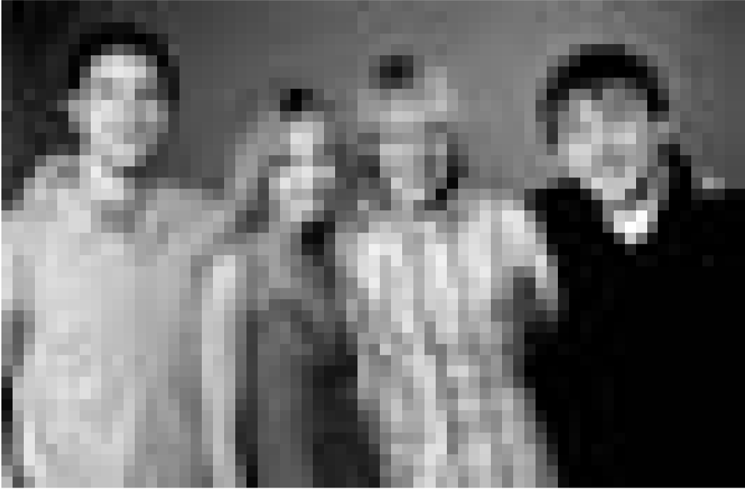
Jeunes acteurs et actrices non-professionnel-le-s improvisent un drame scolaire ... Nathan, Carrie, John et Alex dans "Elephant" de Gus Van Sant. Nouveau à l'Utopia.