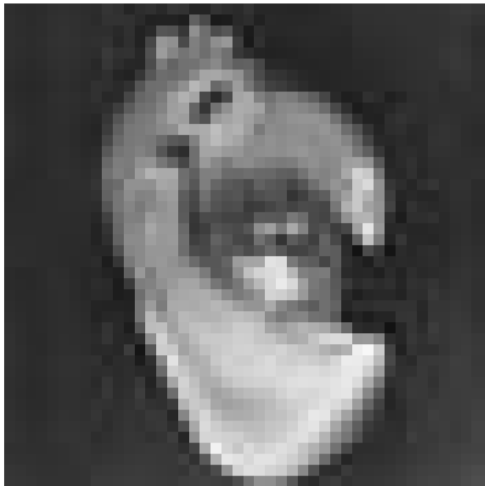
Dans le cadre du Science Festival: "La vie secrète des secrets vivants", des films documentaires développés par Jean Painlevé. Vendredi à la Cinémathèque.

Le "Huit et demi" de Woody Allen. Lors d'une rétrospective de son oeuvre, les angoisses du cinéaste Bates s'exacerbent: il voudrait ne plus être drôle, parler des choses de la vie, être aimé de celles qu'il aime, ne plus être persécuté par ses fans. A la fois perplexe et mélancolique, Allen considère l'enfance et la vieillesse, le bonheur et le malheur, la vie et la mort. Au plus fort de sa réflexion, il s'interroge sur son propre cas: dans un monde de persécution et de souffrance, a-t-il le droit d'être un amuseur?