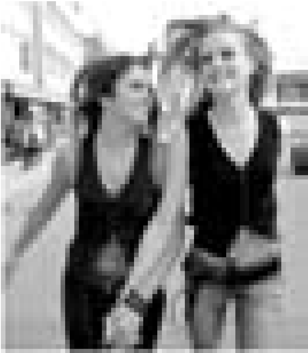
Rebelles à treize ans ... Nikki Reed et Evan Rachel Wood dans "Thirteen" de Catherine Hardwicke. Nouveau à l'Utopia.