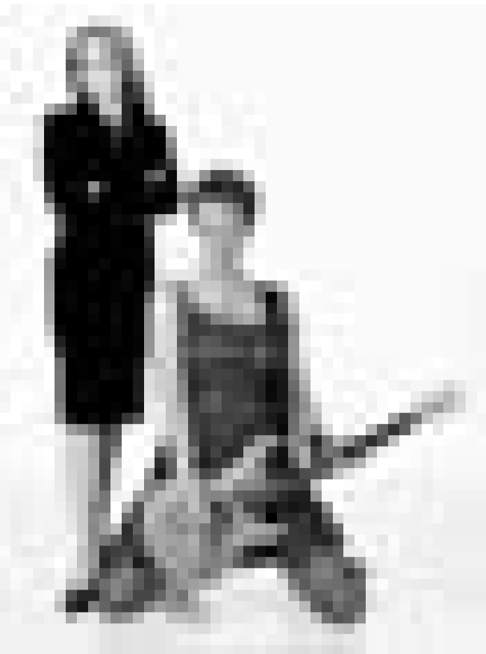
Laquelle est la mère, laquelle est la fille ... Lindsay Lohan et Jamie Lee Curtis dans "Freaky Friday" de Mark S. Waters. A l'Utopolis

Prabbell, ve. - di. 18h + 20h30, lu. + ma. 20h30.