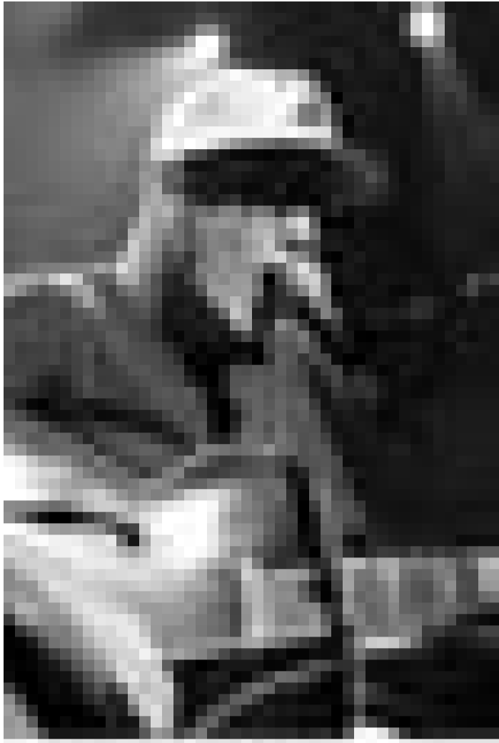
Kurt Wagner et sa formation éclectique "Lambchop" (Nashville) se produiront le 5 mars à l'Atelier.

Schneemann (29 e ), musikalische Unternehmung: Orchestre Philharmonique du Luxembourg unter der Leitung von Carl Davis und der Kinderchor "Pueri Cantores", Conservatoire, Luxembourg, 15h. Tél. 47 08 95.