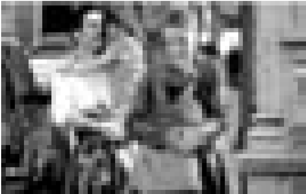
L'Amérique vue par des immigrants irlandais: Paddy Considine et Samantha Morton dans "In America". Nouveau à l'Utopia.