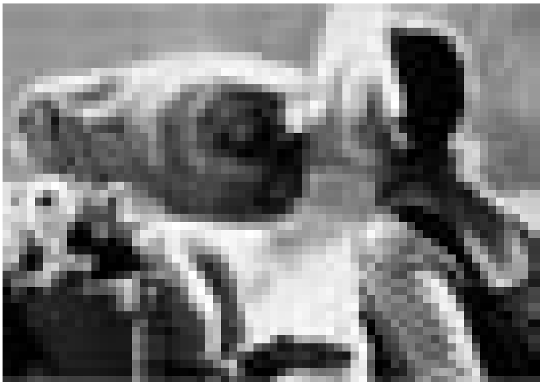
Un extra-terrestre adorable ... "E.T." de Steven Spielberg. Dimanche à la Cinémathèque.

Laughing Gravy (20'), Our Wife (20') et Chickens Come Home (30').