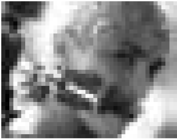
Une population de mutants, d'extraterrestres, d'humains, réels ou synthétiques: "Immortel" troisième long-métrage de Enki Bilal. Nouveau au Ciné Utopolis.

Bien que les mers recouvrent plus des deux tiers de notre planète, nous connaissons mieux la surface de la lune que les fonds des