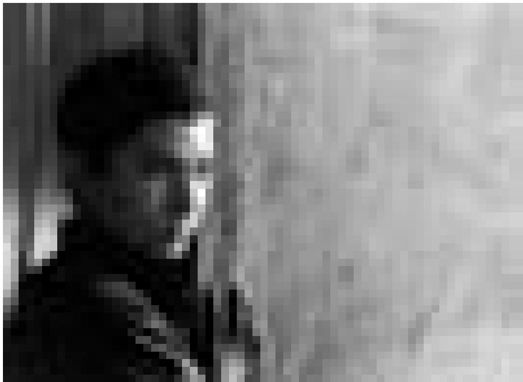
Premier film afghan depuis la destitution des talibans: "Osama" de Sedigh Barmak. Nouveau au Ciné Utopia.