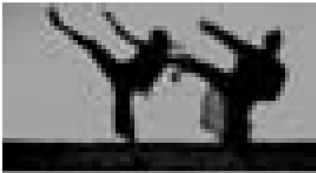
Chorégraphie des tueurs ... "Kill Bill: Volume 2" de Quentin Tarantino. Nouveau à l'Utopolis.

Beck, chasseur de primes, doit traverser la jungle amazonienne pour ramener Travis, le fils d'un riche propriétaire parti dans une chasse au trésor. Après l'avoir retrouvé, les deux hommes vont s'unir pour combattre Hatcher, le gérant cruel et véreux d'une mine d'or.