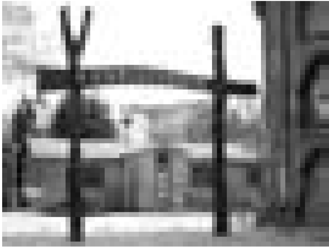
Die zweitgrößte Touristenattraktion Kopenhagens.