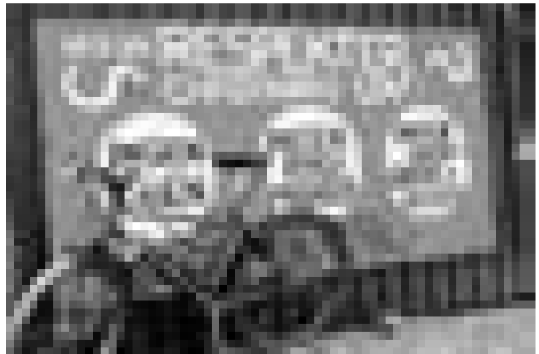
Steht die Hippie-Stadt vor dem Aus?

Nun, da Christiania selbst mit dem Rücken zur Wand steht, könnte das Hippie-Projekt jedoch jede Unterstützung gebrauchen. Denn aus eigener Kraft wird es sich wohl kaum gegen die drohenden Angriffe wehren können. Anstatt wie in alten Tagen Pflastersteine auszugraben, haben die Christianiter einen Brief an die Regierung geschrieben. Darin kündigen sie einen "Kulturkampf" an. Und er geht so: "Wenn es zur Zerstörung Christianias kommt, wird dieser Kulturterrorismus von einem massiven Kulturkampf gestoppt werden. Nicht mit Schießpulver und Kugeln, sondern mit Liebe, Gewaltlosigkeit und zivilem Ungehorsam. Aber es ist nicht unser Wunsch, dass es dazu kommt. Wir wünschen einen konstruktiven Dialog!"