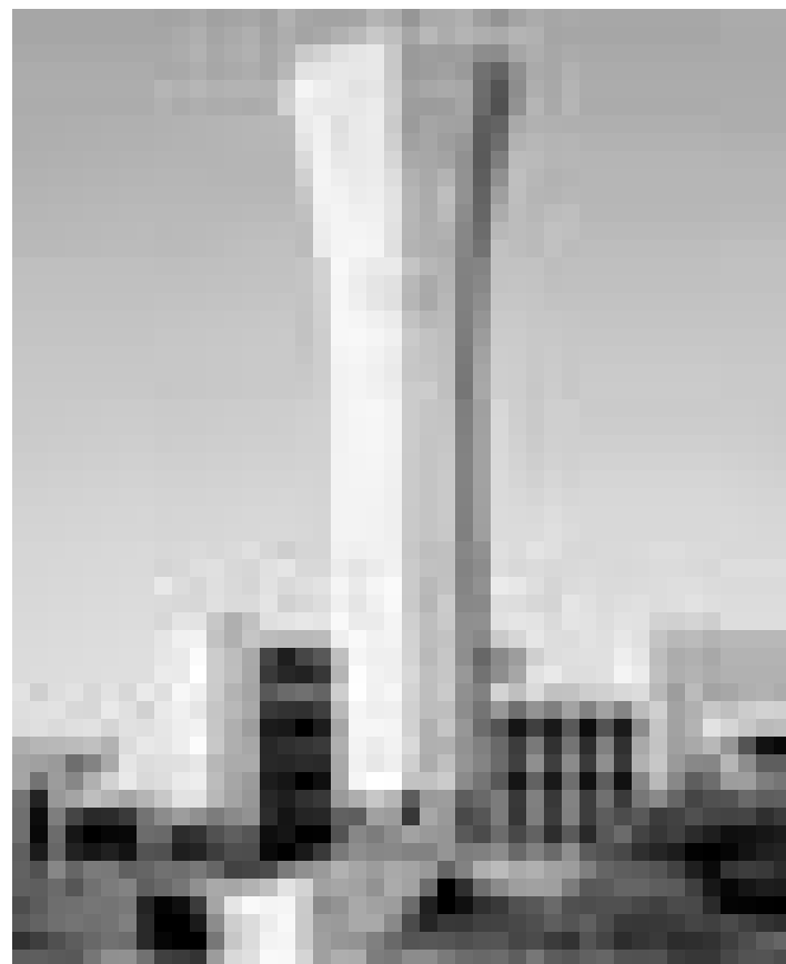
Saudi-Arabien ist der weltweit größte Exporteur für Rohöl. An der King Fahd Universität für Erdöl und Mineralien in Dahrhan bildet das Land seine ExpertInnen aus.