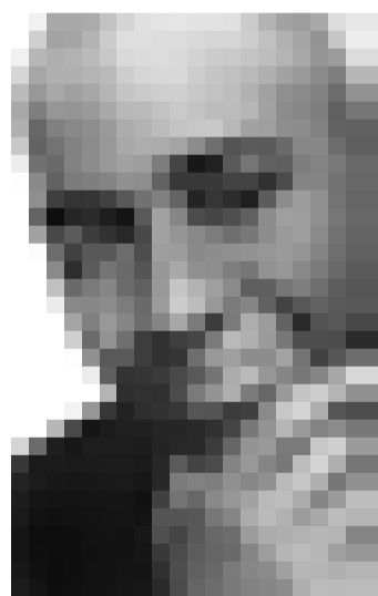
Jazz im Atelier am Montag, den 12. Juli um 21 Uhr, mit dem Saxophonisten Branford Marsalis.

6. Branebuurger Maart am Zeechen vum Waasser , Kannerfloumaart, Fotoausstellung, Viirstellung vu Projeten, Informationsstänn, am ganzen Duerf, Brandenburg, 11h.