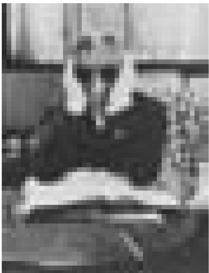
Un homme en manque d'un corps ... "The Invisible Man" de James Whale. Open Air Cinéma, samedi à 22h.

du 9 juillet au 21 août tous les vendredis et samedis à 22 heures entrée gratuite