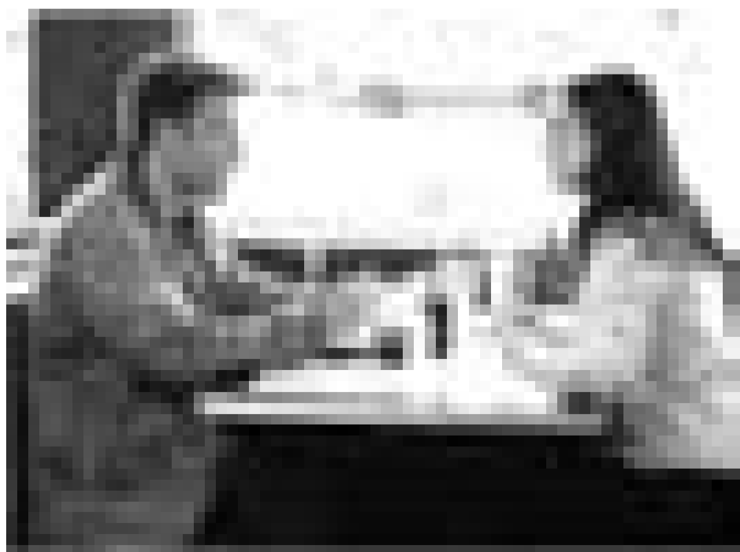
Wenn sich Ben Affleck mit Liv Tyler trifft ... dann bleibt für J.Lo nur eine kleine Nebenrolle. So geschehen in "Jersey Girl" von Kevin Smith. Neu im Utopolis.

Tom Ripley, ancien criminel devenu vendeur d'oeuvres d'art, mène une vie paisible dans une majestueuse villa. Il fait la rencontre de Jonathan, un honnête homme, et le