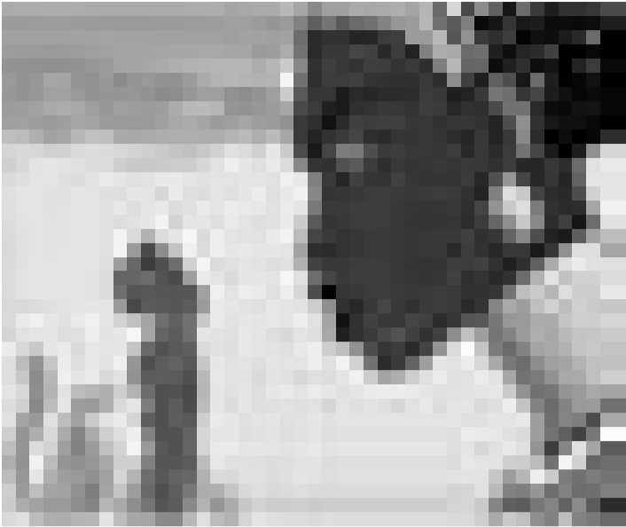
Wiederaufführung des aparten Zeichentrickfilms von Michel Ocelot "Kiriku und die Zauberin". Im Utopia (Luxemburg) und im Kursaal (Rumelange).