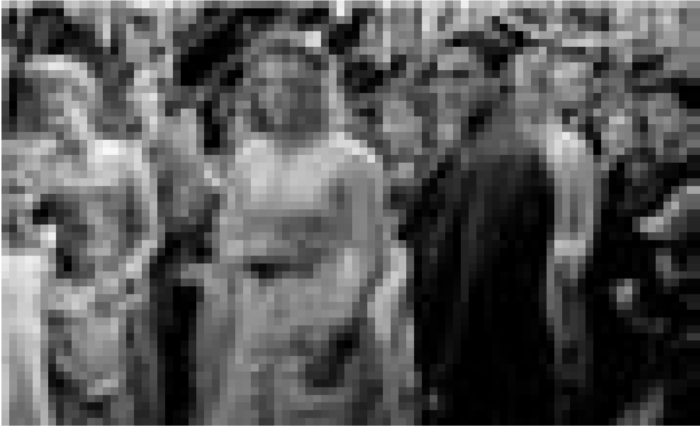
Ein Dorf in Angst und Schrecken: In "The Village" frönt Regisseur M. Night Shyamalan mal wieder seinem Hang zum Übernatürlichen. Vorpremiere am Dienstag im Utopolis.