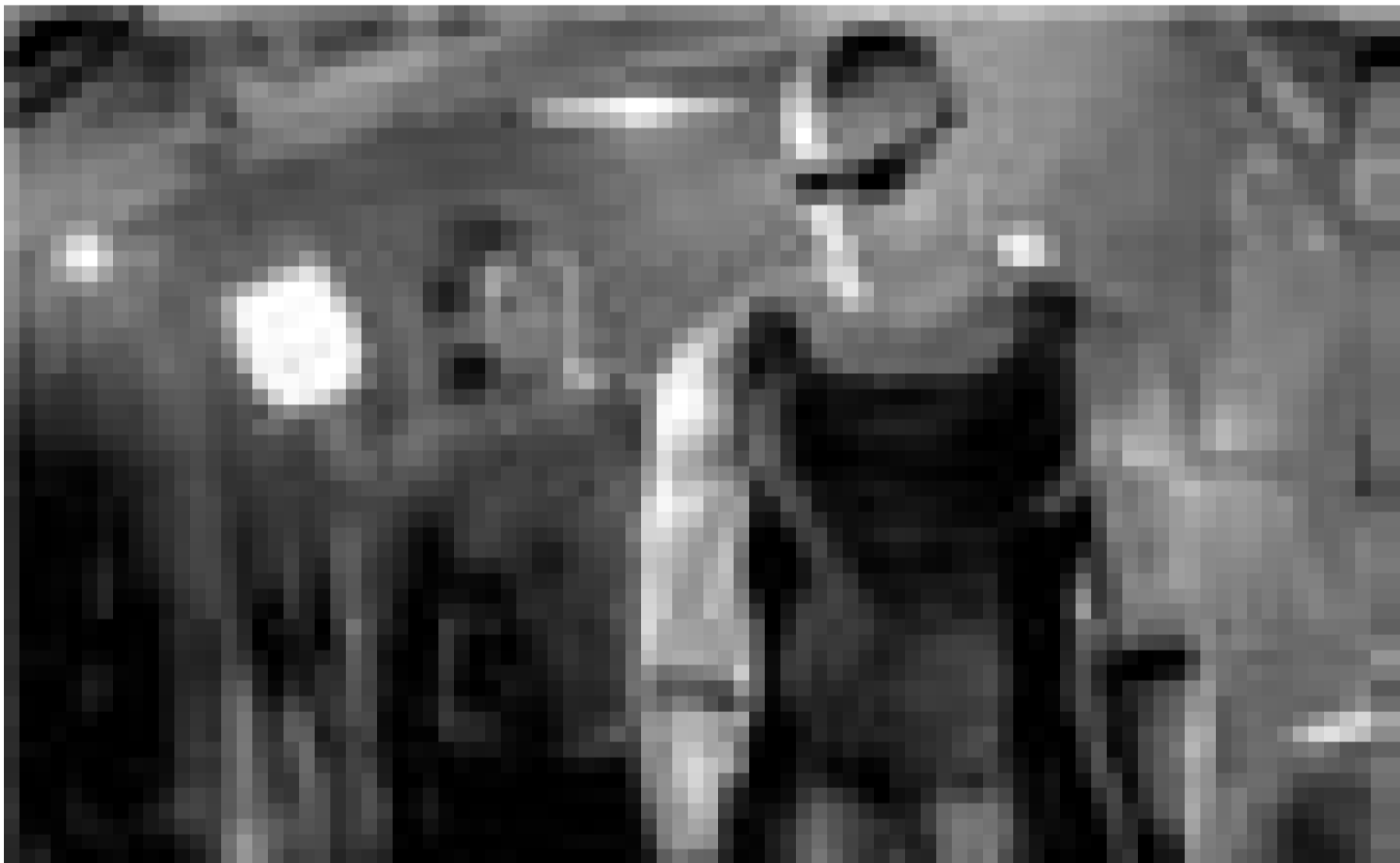
Vin Diesel a piqué ses lunettes à Keanu Reeves pour sauver l'univers dans "Chronicles of Riddick". Nouveau à l'Utopolis (Luxembourg) et à l'Ariston (Esch-sur-Alzette).