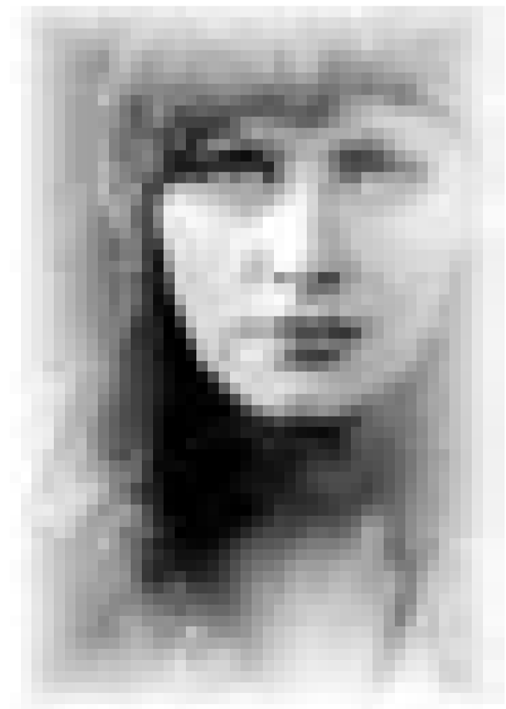
Une femme en manque d'un homme ... Greta Garbo dans "Anna Karenina" de Clarence Brown. Lundi à la Cinémathèque.

Un musicologue distrait se trouve impliqué malgré lui dans une affaire d'escroquerie.