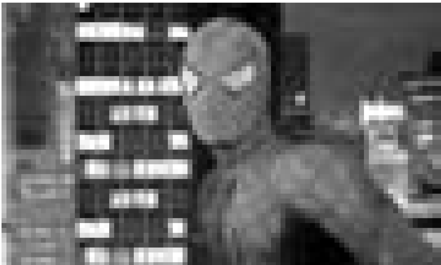
"Spider-Man 2" de Sam Raimi toujours sur plusieurs écrans: cette semaine à l'Utopolis (Luxembourg), au Le Paris (Bettembourg) et au Cinemaacher (Grevenmacher).