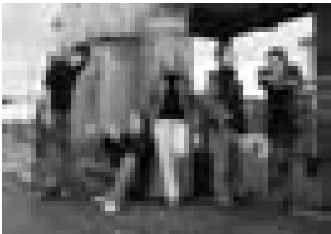
Völklinger-Hütten-Jazz: Funkintension. Am Freitag, den 27. August um 18 Uhr im Weltkulturerbe.

Painter of the living jungle, visite guidée, Musée national d'histoire et d'art, Luxembourg, 16h. Tél. 47 93 30-214.