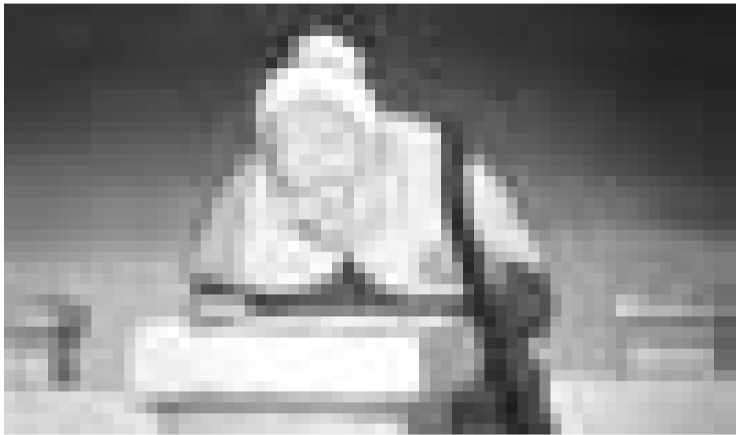
Die luxemburgische Co-Produktion "Der blaue Pfeil" von 1998 war ein Erfolg in den hiesigen Kinosälen. Für jene die diesen Film verpassten wird er nochmal im Kinosch (Esch) gezeigt.