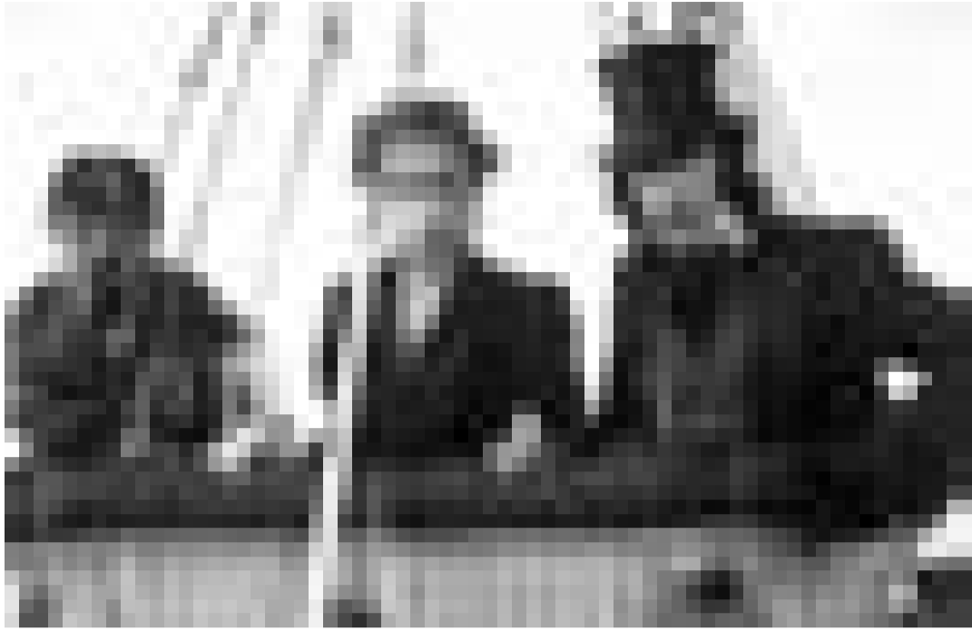
Science fiction du 19e siècle: "Around the World in 80 Days" à l'Utopolis.