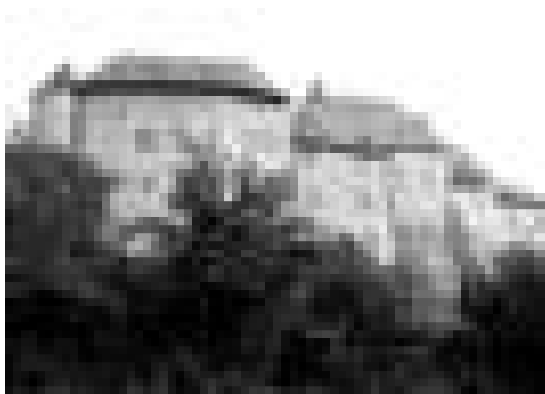
Unter dem Motto "Kulturgut - Vergangenheit und Zukunft" öffnen am Sonntag, dem 12. September historische Bauwerke in Luxemburg und in der Grenzregion ihre Tore kostenlos für die BesucherInnen.

La collection Mansfeld à travers le Musée national d'histoire et d'Art et le Musée de la Ville de Luxembourg , visite guidée, Musée