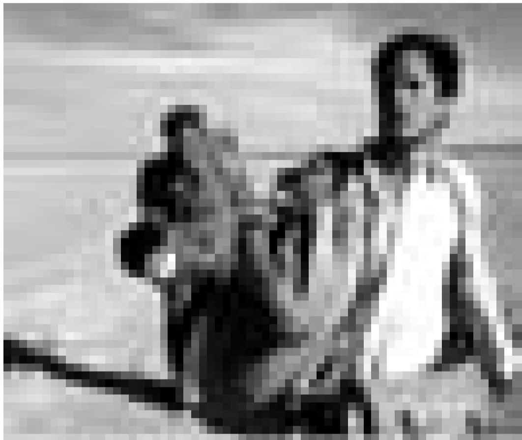
Eine Odyssee durch Südamerika: Alberto Granado (Rodrigo de la Serna) und Ernesto Guevara (Gael Garcia Bernal) in der Atacama-Wüste.