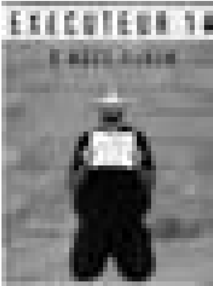
Comment survivre au coeur du conflit? "Exécuteur 14" d'Adel Hakim, le 8, 9, 11 et 12 octobre à 20h au Théâtre de la Ville d'Esch.