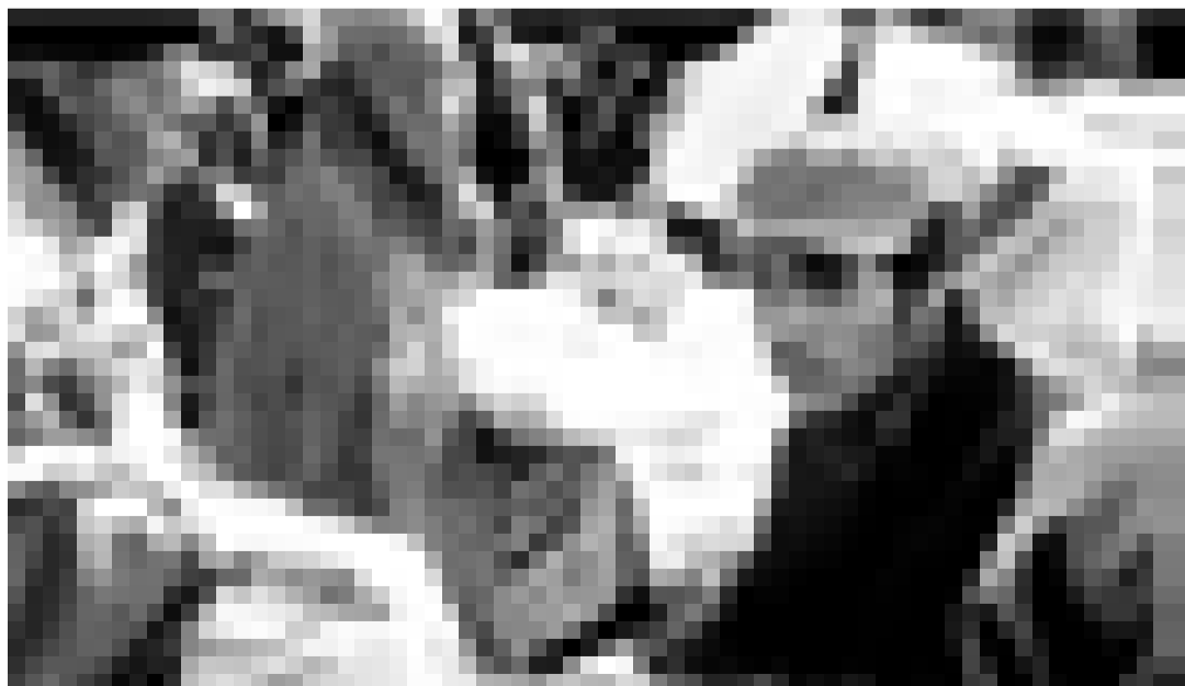
La quotidien des travailleurs aux origines multiples sur un chantier à Téhéran. "Baran", dans le cadre du Cinédit à l'Utopia.

XX Gackemde Hühner, weinende Esel und ein wilder Haufen dörfischer Stimmungskanonen - in all dem Klamauk geht die Tragik des Jugoslawien-Konflikts unter. (ik)