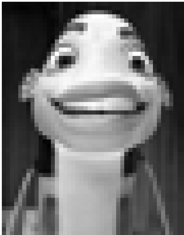
Aussi les poissons ont des dents, du moins dans "Shark Tale". Nouveau à l'Utopolis (Luxembourg), à l'Ariston (Esch-sur-Alzette) et au Kursaal (Rumelange).