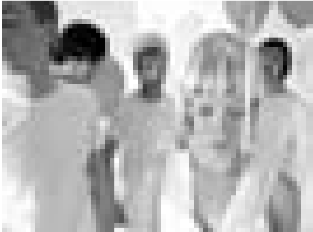
99 Luftballons - am Mittwoch, den 3. November lässt "Mia" ab 21 Uhr die brandneue deutsche Welle im Hollericher Atelier rollen.

Rencontres internationales d'improvisation théâtrale, Centre culturel de rencontre Abbaye de Neumünster, Luxembourg , 20h30.