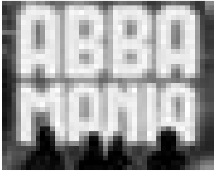
Eine Reunion gibt's zwar nicht, aber den unverwundlichen Nostalgikern bleibt immerhin die "Abba Mania". Am Samstag, dem 15. Januar macht die Show um 20 Uhr Station in der Sporthalle in Differdingen.

Festsall (276, rue du Rollingergrund), Luxembourg, 16h. Tel. 40 66 89.