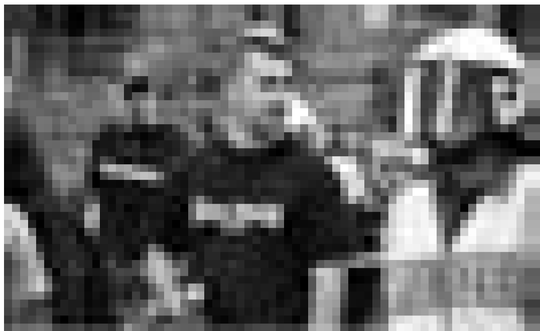
Vom Staat geschützt und bezahlt: Immer mehr Stiefelnazis treten der NPD bei und verbreiten dort ihr menschenverachtendes Gedankengut.

Spätestens der Einzug der NPD in den sächsischen Landtag hat ein Tabu gebrochen: Es ist in der Bundesrepublik möglich, ganz offen und auf höchster staatlicher Ebene Politik mit antisemitischen und rassistischen Inhalten zu betreiben, ohne dass dies - von einer kurzlebigen Medienkampagne abgesehen - einen Skandal darstellen würde. Die Tatsache, dass Kandidaten der NPD im sächsischen Landtag regelmäßig mehr Stimmen erhalten, als die NPD-Fraktion Mitglieder hat, zeigt die bedrohlichen Ausmaße, die diese "Normalisierung" mittlerweile angenommen hat.