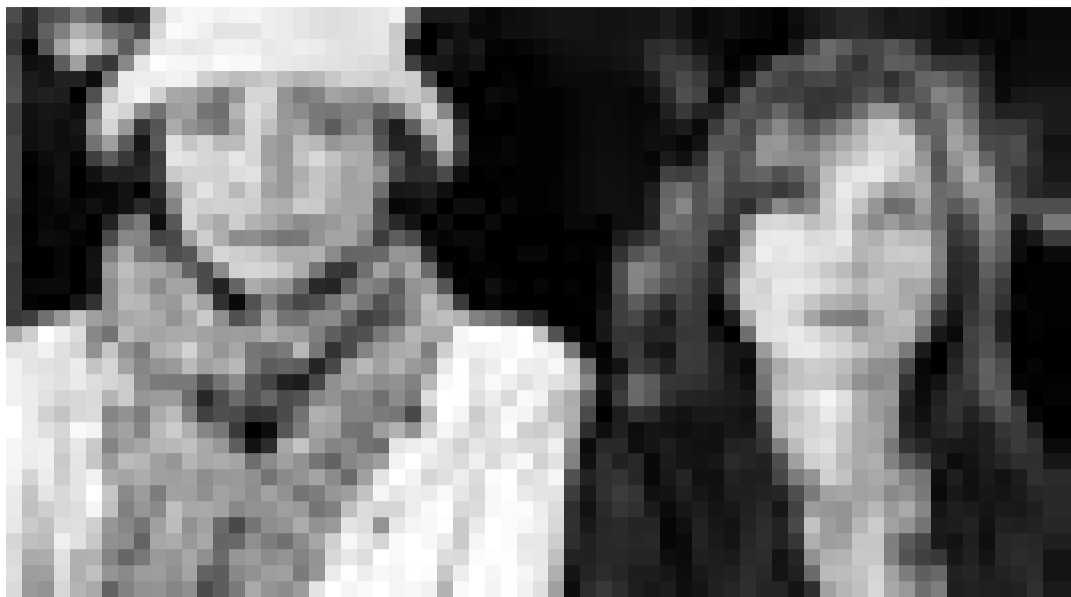
Soeurs, mais pas trop ... Catherine Frot et Isabelle Huppert s'affrontent dans "Les soeurs fâchées". Nouveau à l'Utopolis.

La jeune Melinda fait irruption dans un dîner mondain. Elle s'incruste dans la vie de deux couples, suscitant ici la tentation de l'infidélité, là une passion amoureuse.