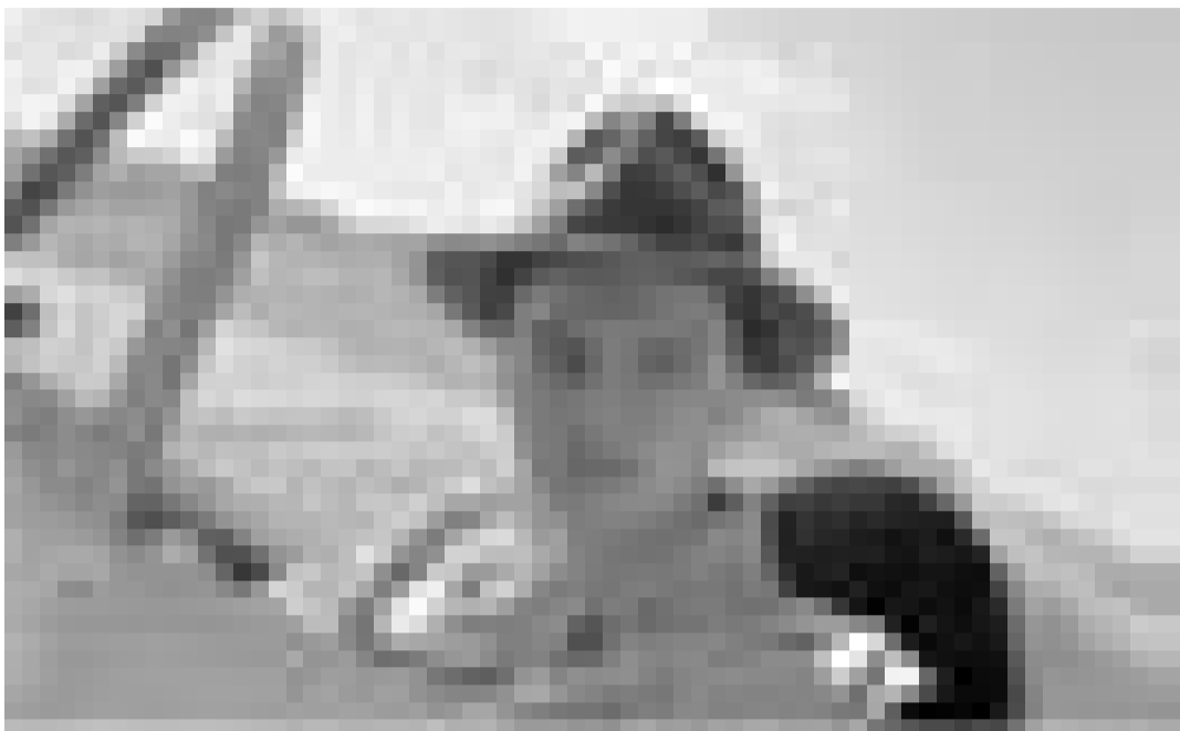
Howard Hughes (Leonardo DiCaprio) sur le point de décoller dans l'épique "The Aviator", signé Martin Scorsese. Nouveau à l'Utopolis.