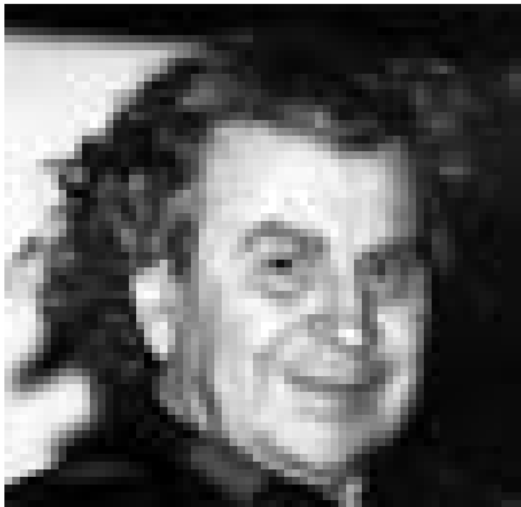
La musique de chambre du compositeur Mikis Theodorakis sera à l'honneur ce vendredi, 4 février à 20h au Centre national de littérature à Mersch.

Bleeding Through, Cult of Luna and Six Reasons to Kill , Metal,