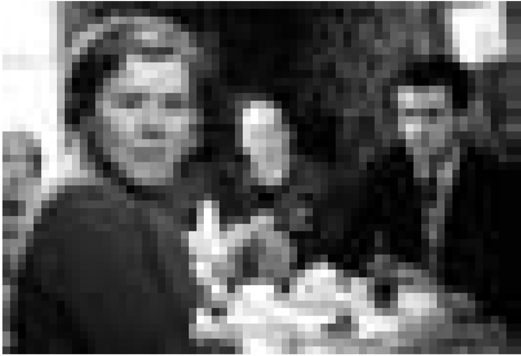
Une des favorites pour l'Oscar de la meilleure actrice: Imelda Staunton dans "Vera Drake". Nouveau à l'Utopia.