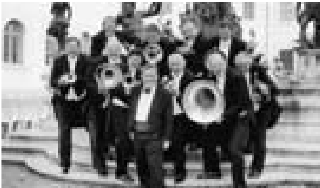
De Bach à Bon Jovi: l'ensemble "Blebschaden" présentera son répertoire éclectique ce dimanche, 3 avril, à 16h et à 20h au Conservatoire de la Ville de Luxembourg dans le cadre du Printemps Musical.