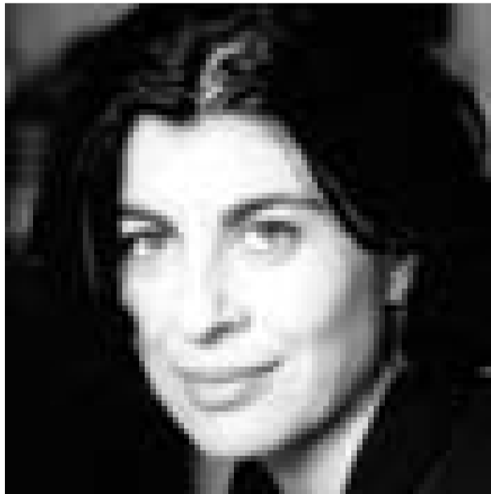
Das preisgekrönte Drama "Pessach" von Laura Forti in einer Inszenierung von Hansgünther Heyme ist am 6., 7., 8. und 9. April um 20 Uhr im Théâtre National zu sehen.

Jetzt kommt's Hertha , Kabarett, Pop und kleine Hexereien mit