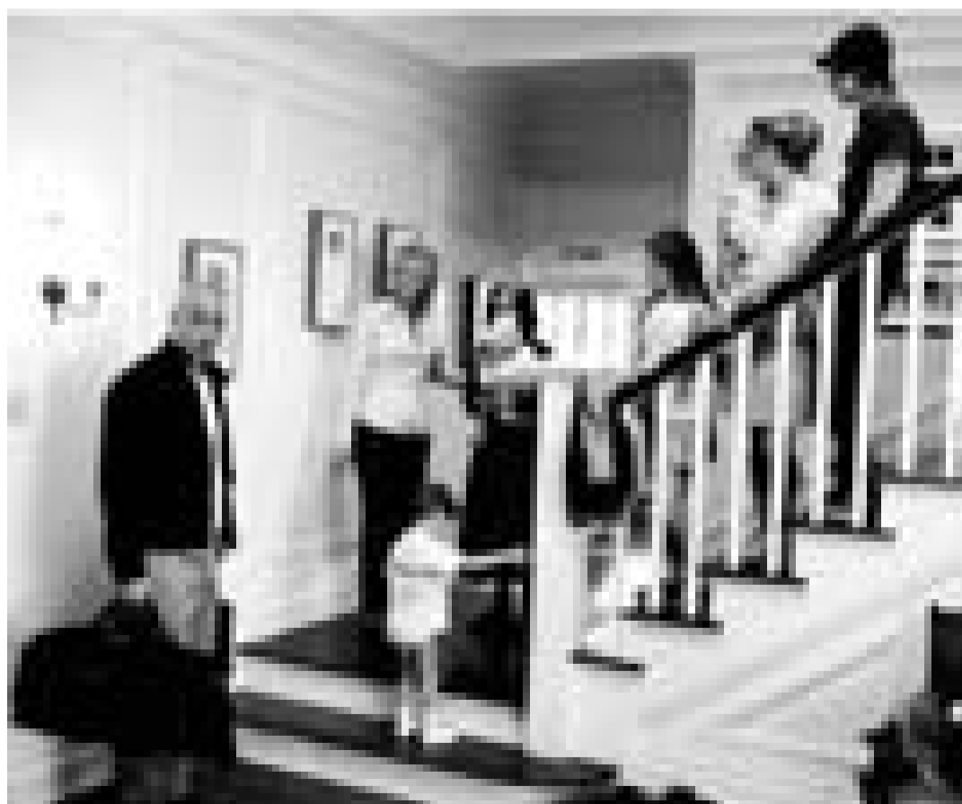
Hulk Hogan und Arnold Schwarzenegger haben's vorgemacht. Wenn sich ein Muskelprotz um kleine Kinder kümmert, wird es so richtig lustig. Vin Diesel spielt den Babysitter in "The Pacifier". Neu im Utopolis.