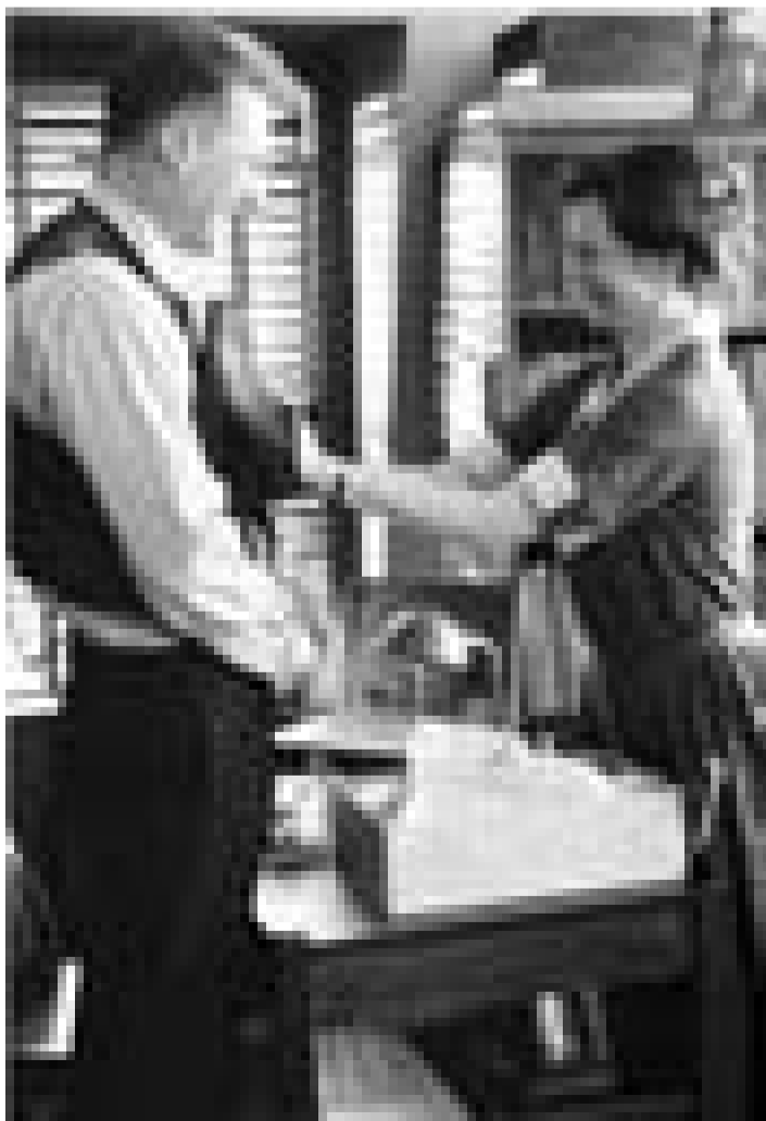
Professeur Kinsey (Liam Neeson) s'est trouvé une épouse dévouée (Laura Linney). A l'Utopia.