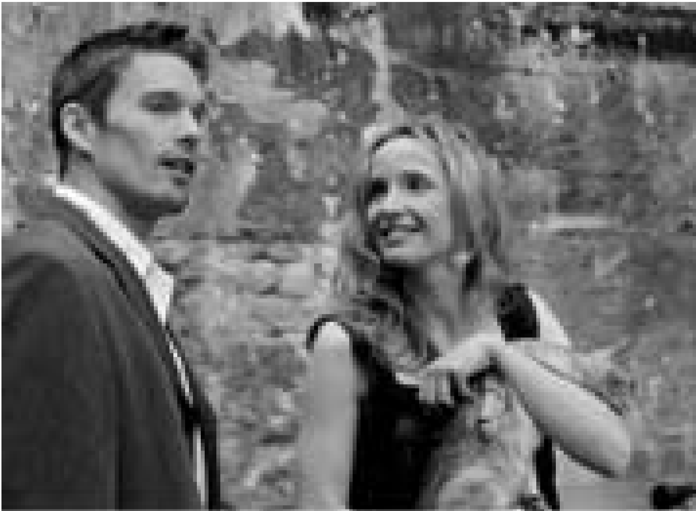
Jesse (Ethan Hawke) et Céline (Julie Delpy) s'offrent une deuxième chance ... "Before Sunset" à l'Utopia. Voir Filmtipp page 13.