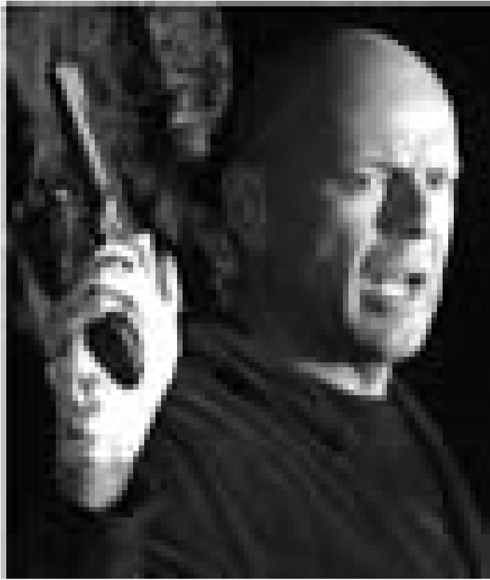
Bruce Willis schlüpft in seine liebste Rolle: In "Hostage" spielt er mal wieder den gerechten Gesetzeshüter. Neu im Utopolis.