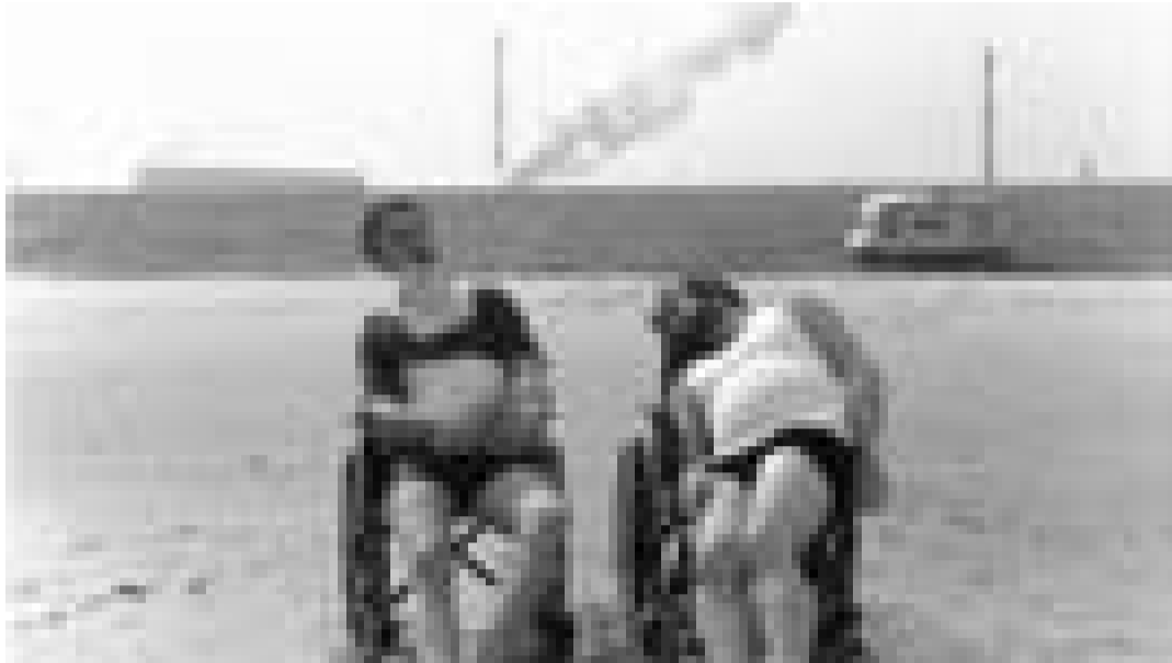
Deux ennemis avec un même but - se venger de celui qui les a privés de l'usage de leurs jambes dans "Aaltra". Organisé par EcranApart, mardi à l'Utopia.