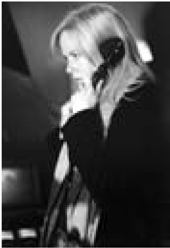
Une interprète (Nicole Kidman) se retrouve au milieu d'un complot dans "The Interpreter". Nouveau à l'Utopolis.