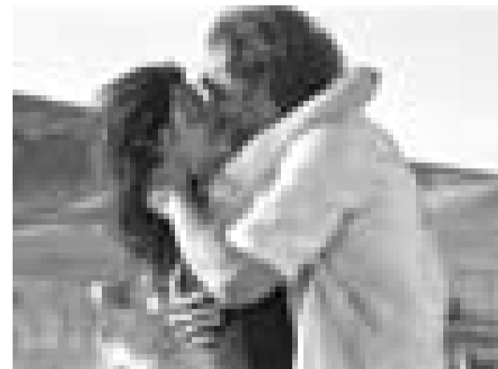
Hollywood-Helden haben's gut: Sie können die Welt retten und gleichzeitig heftig flirten. Penelope Cruz und Matthew McConaughey machen es vor in "Sahara". Neu im Utopolis.

USA 2005 von John Pasquin. Mit Sandra Bullock, Regina King und Enrique Murciano. 115'. Kinder zugelassen.