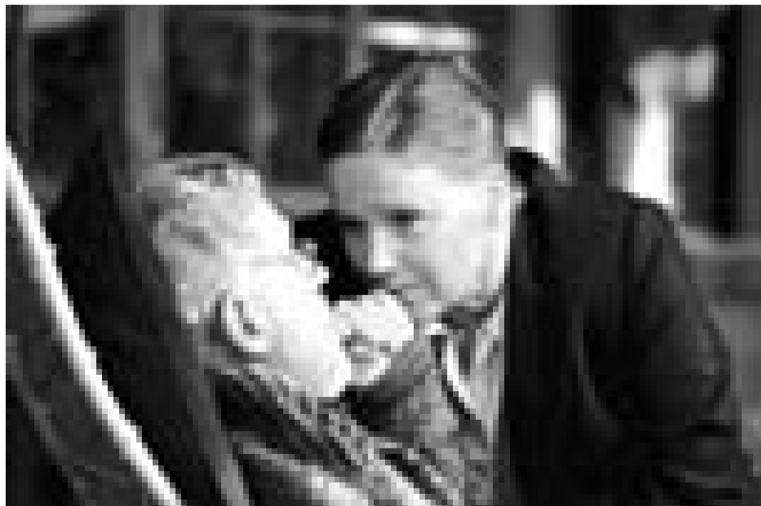
Liv Ullmann et Erland Josephson se retrouvent dans "Saraband" d'Ingmar Bergman. A l'affiche pendant une semaine seulement à l'Utopolis.

Utopolis , ve. - je. 19h30 + 22h. (5e sem.).