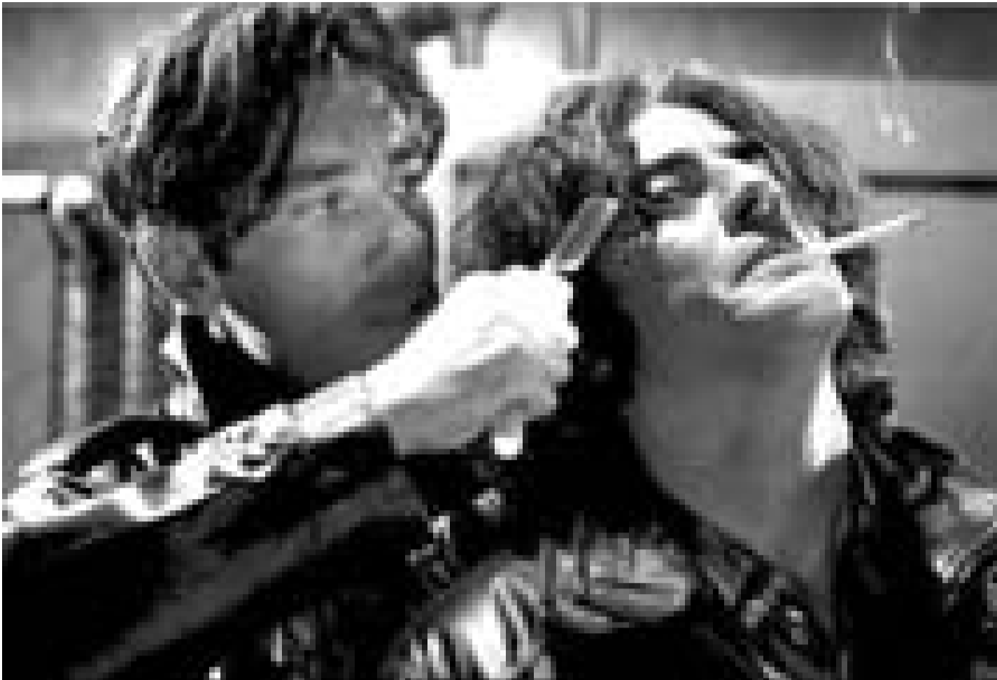
Clive Owen et Benicio del Toro se crêpent le chignon dans "Sin City". Nouveau à l'Utopolis.