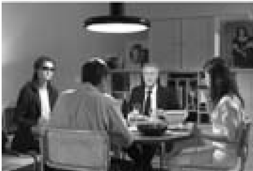
Petit dîner entre ennemi-e-s: Charlotte Rampling, André Dussolier, Charlotte Gainsbourg et Laurent Lucas dans "Lemming". Nouveau à l'Utopia.