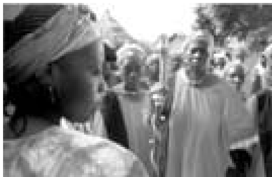
Sembene Ousmane met en scène la lutte entre tradition et modernité dans "Moolaadé". En avant-première à l'Utopia.