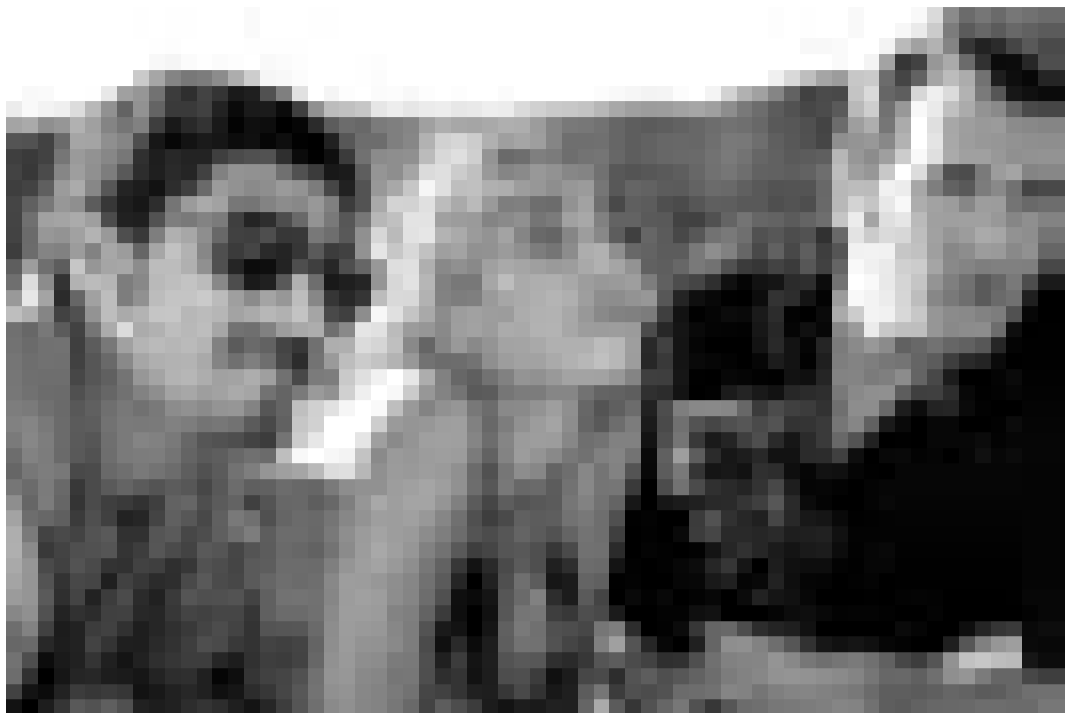
Quand un gars (à dr. Jean Dujardin d'"Un gars et une fille") aime une fille (Caterina Murino) mariée à un autre gars (Pascal Elbé), ça fait du désordre dans "L'amour aux troussees". Nouveau à l'Utopolis.

Spektakuläre Verfilmung von H.G. Wells Science-Fiction-Roman "Krieg der Welten". Nicht Natur-