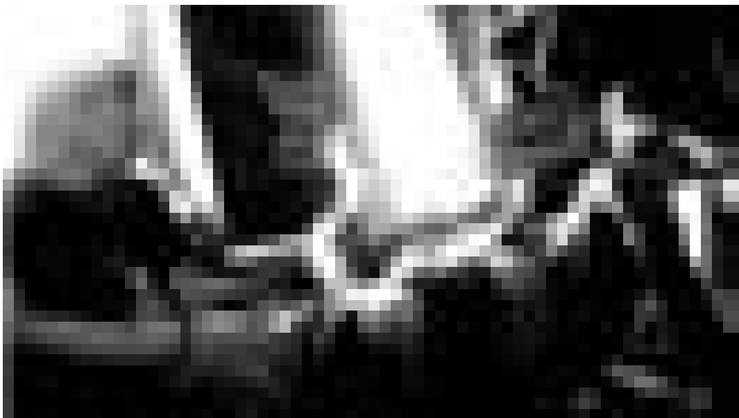
Auf und abseits der Bühne: Do Androids Dream of Electric Sheep?