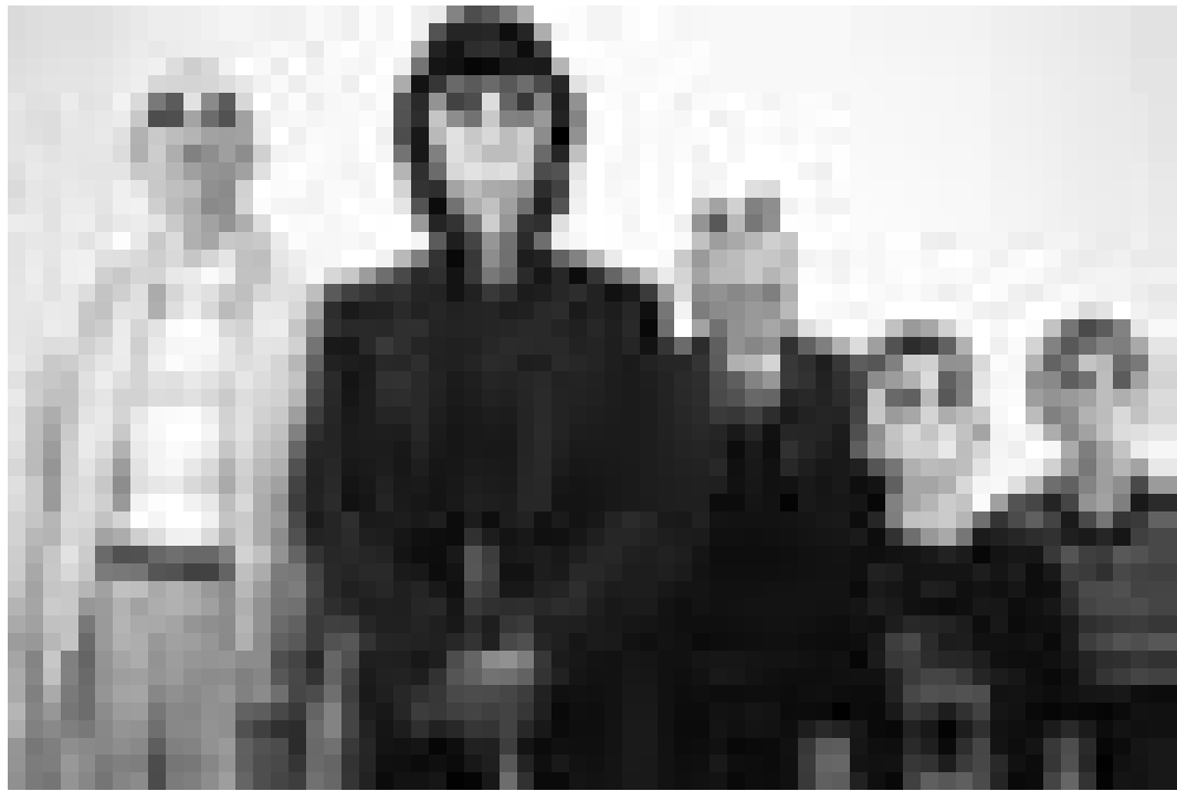
Trop de trouvailles visuelles peuvent donner mal aux yeux: Willy Wonka (Johnny Depp) et ses visiteurs ont bien fait de mettre leurs lunettes.