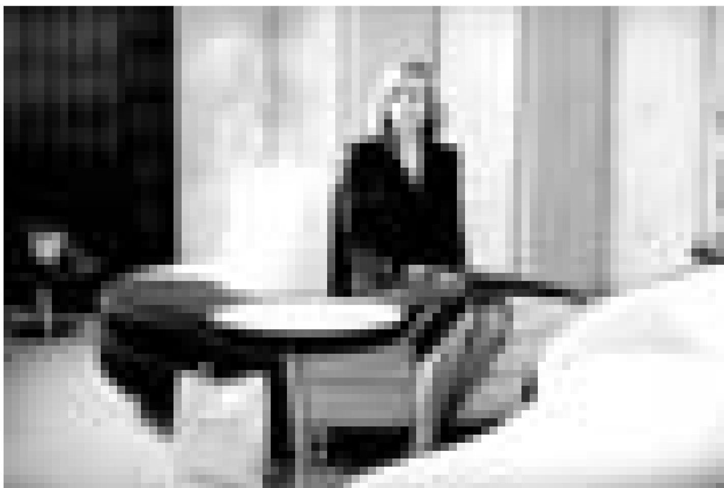
Une série de courts métrages avec des intervenants aussi illustres que Cate Blanchett: "Coffee and Cigarettes" de Jim Jarmusch. Enfin à l'Utopia.