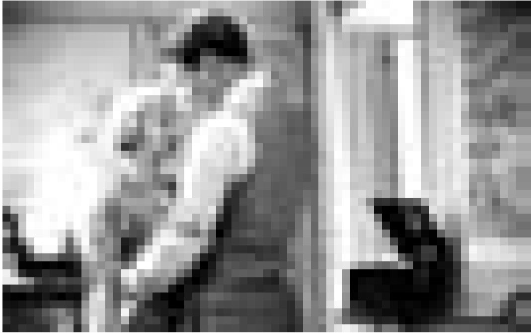
Ehebruch à la Oscar Wilde ... Scarlett Johansson und Stephen Campbell Moore in "A Good Woman", inszeniert von Mike Barker. Neu im Utopia.