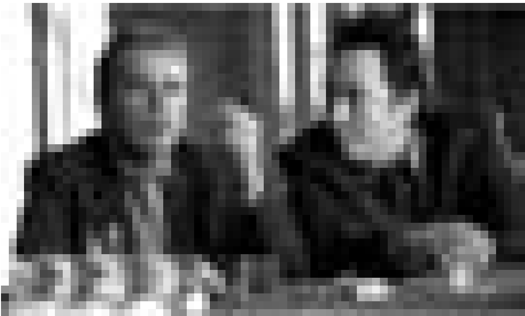
Zwei Partner schmieden schräge Pläne. Billy Bob Thornton et John Cusack in "The Ice Harvest" von Harold Ramis. Neu im Utopolis.