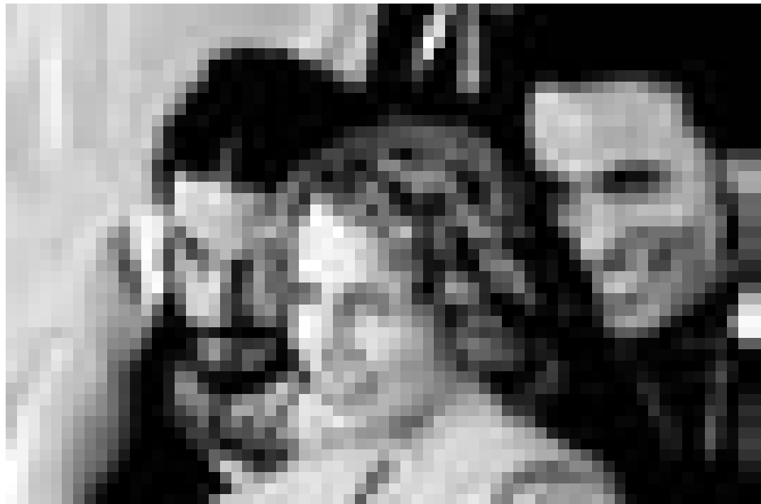
Deux jeunes musiciens cubains sur le point de réussir. "Habana Blues" de Benito Zambrano. Nouveau à l'Utopia.