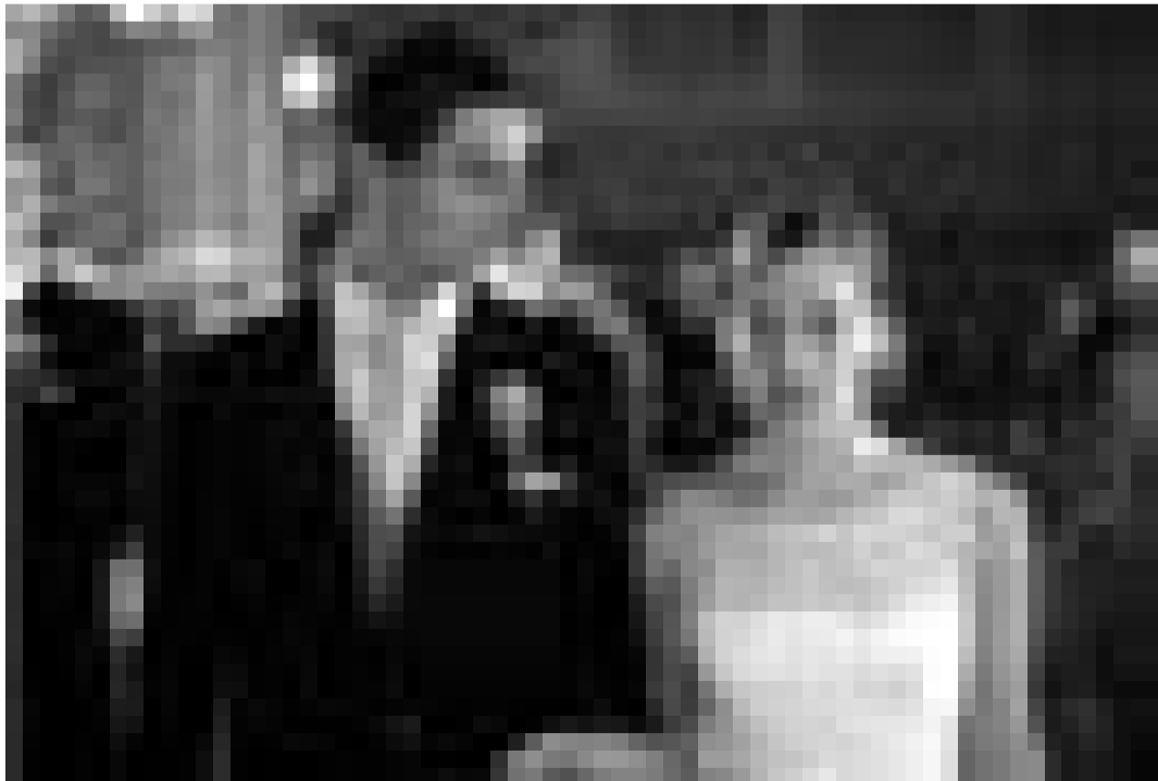
Incertitude au moment décisif ... Matthew Goode et Piper Perabo dans "Imagine Me & You" de Ol Parker. Nouveau à l'Utopolis.

Ein Unfall und die dramatische Verschlechterung der Wetterlage zwingen ein Forscherteam ihre Expedition zum Südpol frühzeitig abzubrechen und