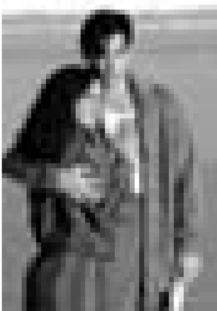
Glück in der Liebe, Schwierigkeiten mit der Vermögensbildung ... Salma Hayek und Colin Farrell in "Ask the Dust" von Robert Towne. Neu im Utopolis.