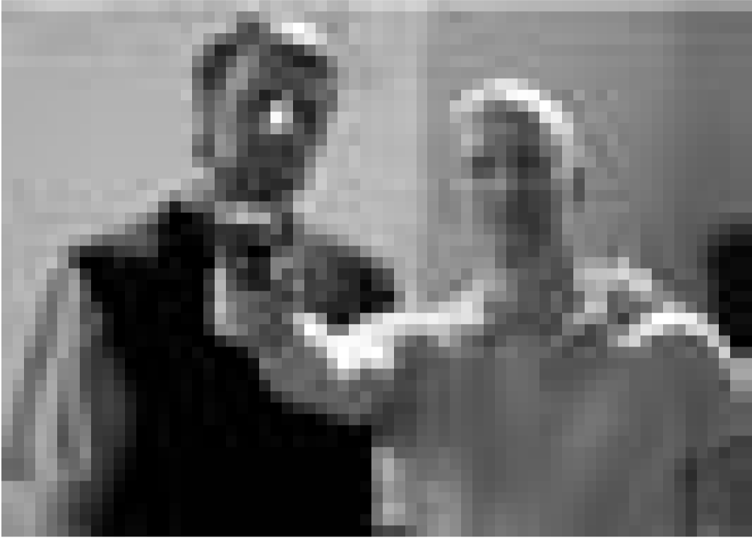
La foi du pasteur Ivan face à la malveillance du taulard Adam. Mads Mikkelsen et Ulrich Thomsen dans "Adams aebler" de Anders-Thomas Jensen. Nouveau à l'Utopia.