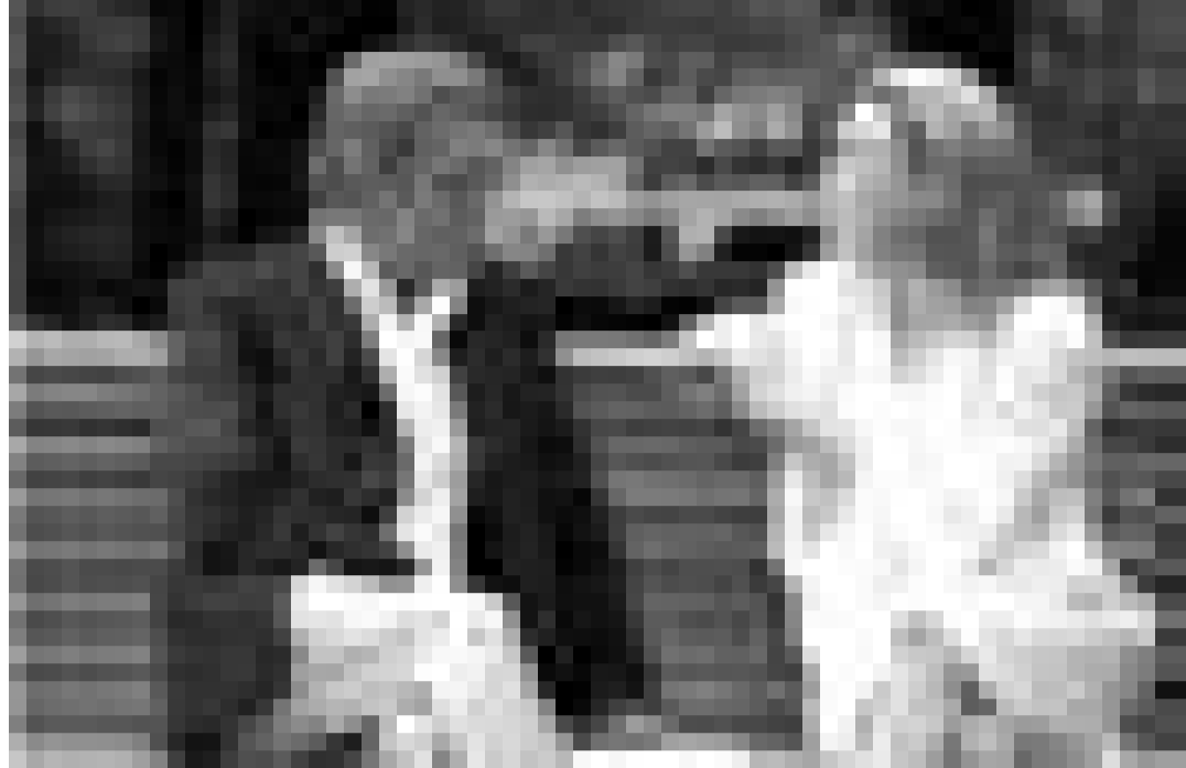
Geheimagent Pete Garrison und die First Lady machen sich Sorgen um den Präsidenten. Michael Douglas und Kim Basinger in "The Sentinel" von Clark Johnson. Neu im Utopolis.

Isa, Alice, Léa et Nina, quatre amies, partagent leurs vies entre les histoires de coeur, un institut de beauté sous contrôle fiscal, des enfants à élever, une nounou marocaine sans papiers à pacser,