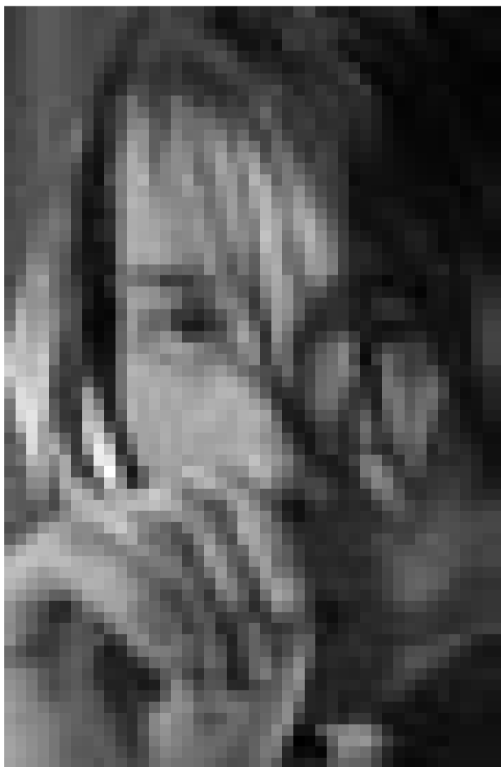
A l'âge ou d'autres fument il suce toujours son pouce. Lou Taylor Pucci est le "Thumbsucker" dans le film de Mike Mills. Nouveau à l'Utopia.

XXX Nüchtern referiert der Film auf verschiedenen Ebenen die Ereignisse ab dem Moment der ersten Entführung. Harte Schnitte und eine durchweg subjektive Kamera sorgen dafür, dass dem Zuschauer keine Möglichkeit zum Durchatmen bleibt. (Thorsten Fuchshuber)