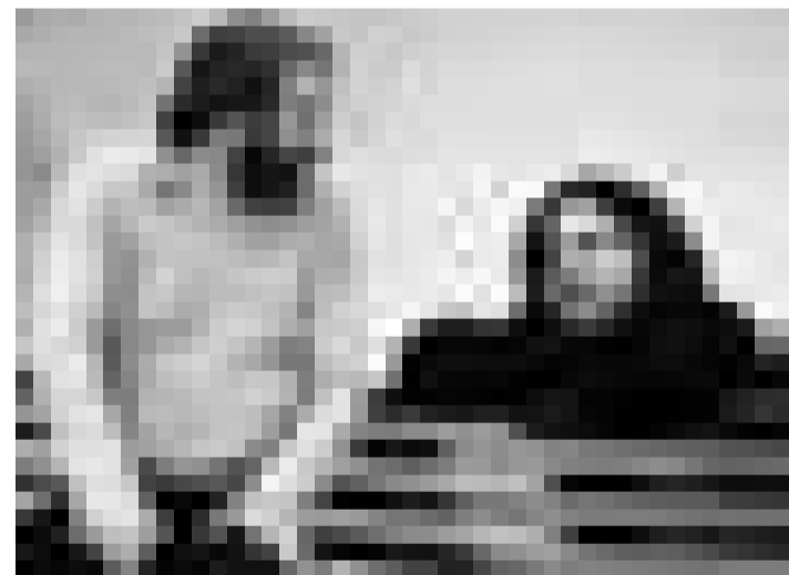
Die neue Produktion von ILL, der Einakters "Zoo Story" von Edward Albee feiert am 24. September in der Escher Kulturfabrik Premiere.

Utopia je ne savais pas qu'Ulrike était mon amie , pièce de et par Caroline Crozat-Martinelli, Le Gueulard, Nilvange, 20h30. Tél. 0033 03 82 85 50 71.