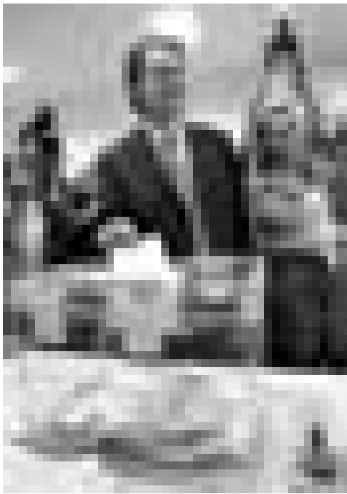
Artur Mas, Vorsitzender der nationalistischen CiU, bei der Stimmabgabe zu den katalanischen Regionalwahlen am Mittwoch vergangener Woche

Als im Frühjahr die Reform des katalanischen Autonomiestatuts verhandelt wurde, lautete die Kritik des PP, dass die sozialdemokratische Regierungspartei PSOE die Einheit Spaniens zerstöre. Von linken Gruppen und Parteien kam dagegen der Einwand, dass sie gerade das nicht tue. Das Regionalparlament hatte im ersten Entwurf der Reform Katalonien als "Nation" bezeichnet, woraufhin der PP eine Unterschriftenaktion startete, um eine Volksabstimmung herbeizuführen. Über vier Millionen Spanier, fast zehn Prozent der Bevölkerung, unterschrieben die Aussage, Spanien sei "die