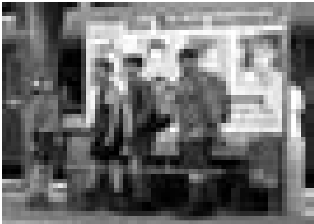
1964: Vier Lausbuben treiben ihr Unwesen in Bern. "Mein Name ist Eugen", Kinderfilm von Michael Steiner. Neu im Utopolis.

USA 2006 de Tony Scott. Avec Denzel Washington, Jim Caviezel et