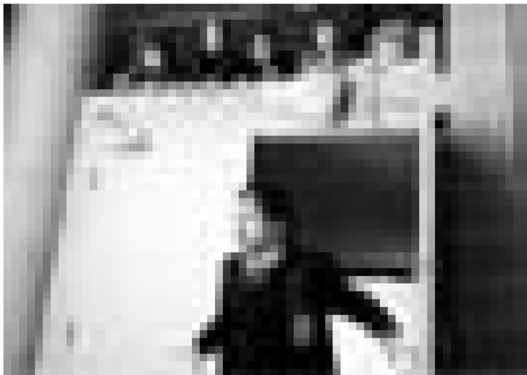
Ein Flughafen wird zum Abenteuerspielplatz. "Unaccompanied Minors", Kinderfilm von Paul Filg. Neu im Utopolis.