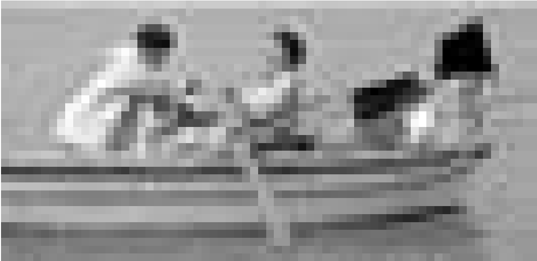
Un instituteur et un écolier se donnent des leçons. "Salvatore - Questa è la vita" de Gian Paolo Cugno. Nouveau à l'Utopia.