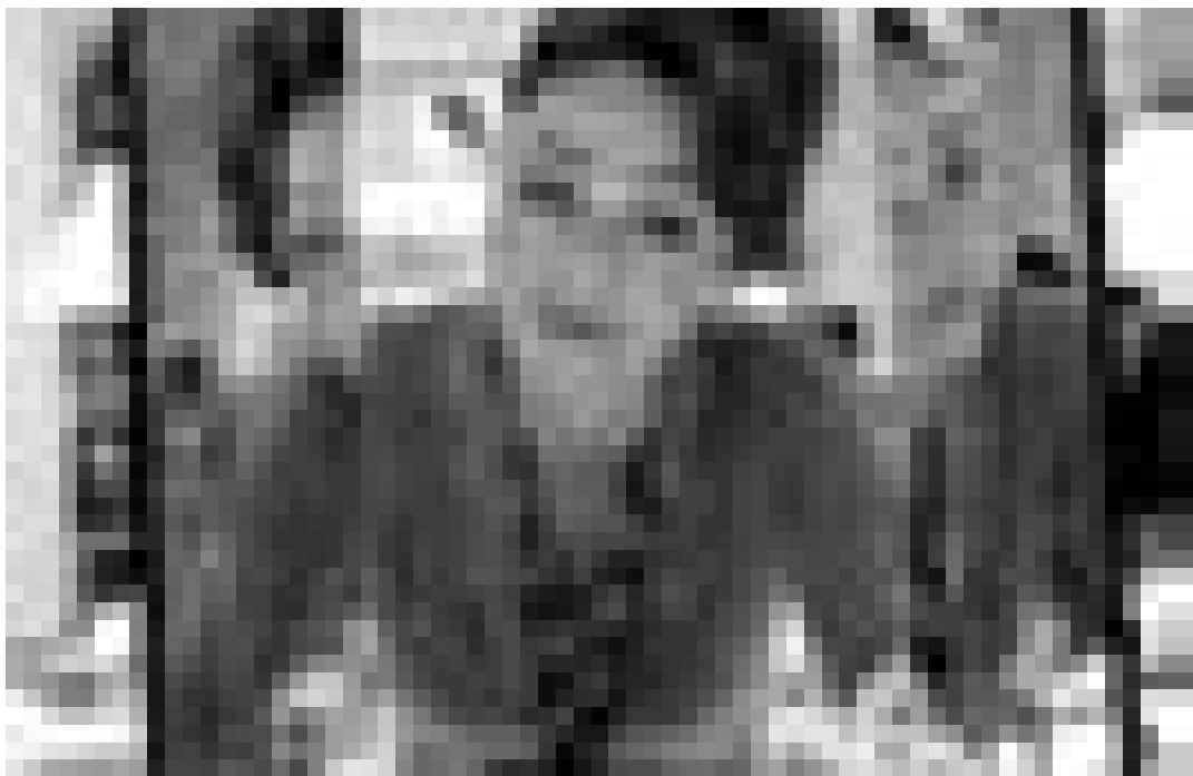
Une femme atypique ... Catherine Frot dans "Odette Toulemonde" d'Eric-Emmanuel Schmitt. Nouveau à l'Utopolis.