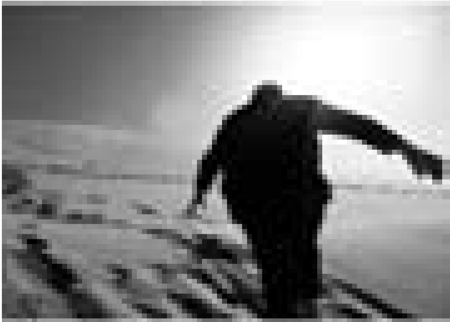
Aventures avec aventuriers à l'appui. "Exploration du Monde" le rend possible