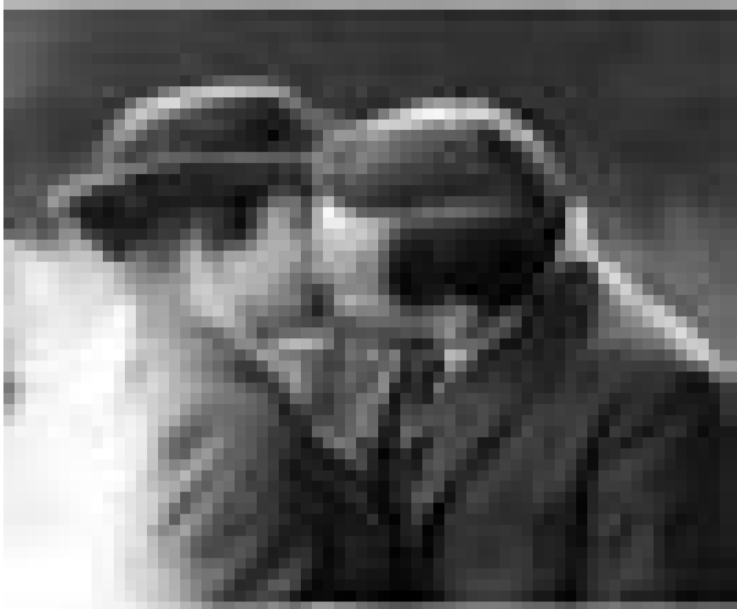
Kinderbuchautorin Beatrix Potter findet in ihrem Verleger die Liebe, von der sie nie zu träumen wagte. Renée Zellweger und Ewan McGregor in "Miss Potter" von Chris Noonan. Neu im Utopolis (Luxemburg) und im Scala (Diekirch).