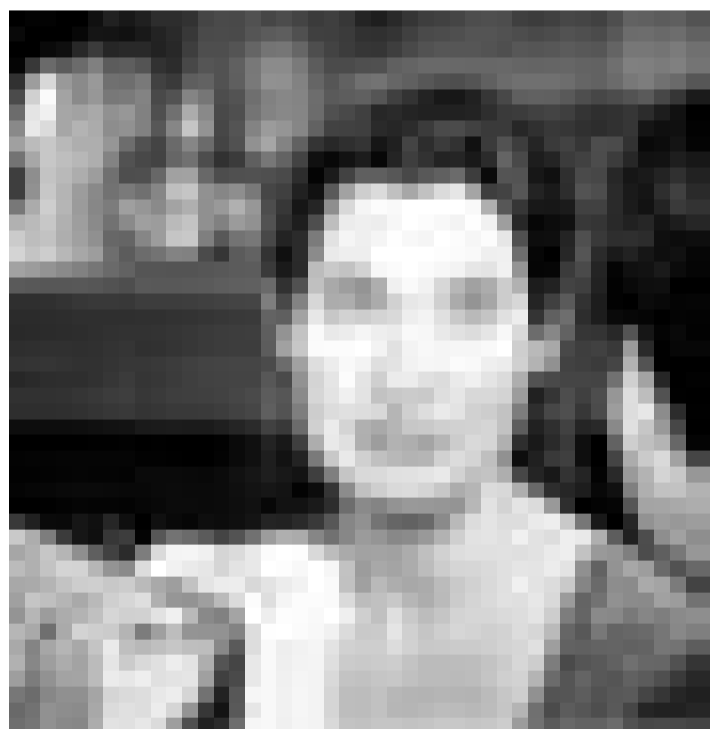
Confidente de secrets. Emmanuelle Devos dans "J'attends quelqu'un" de Jérôme Bonnell. Nouveau à l'Utopia.