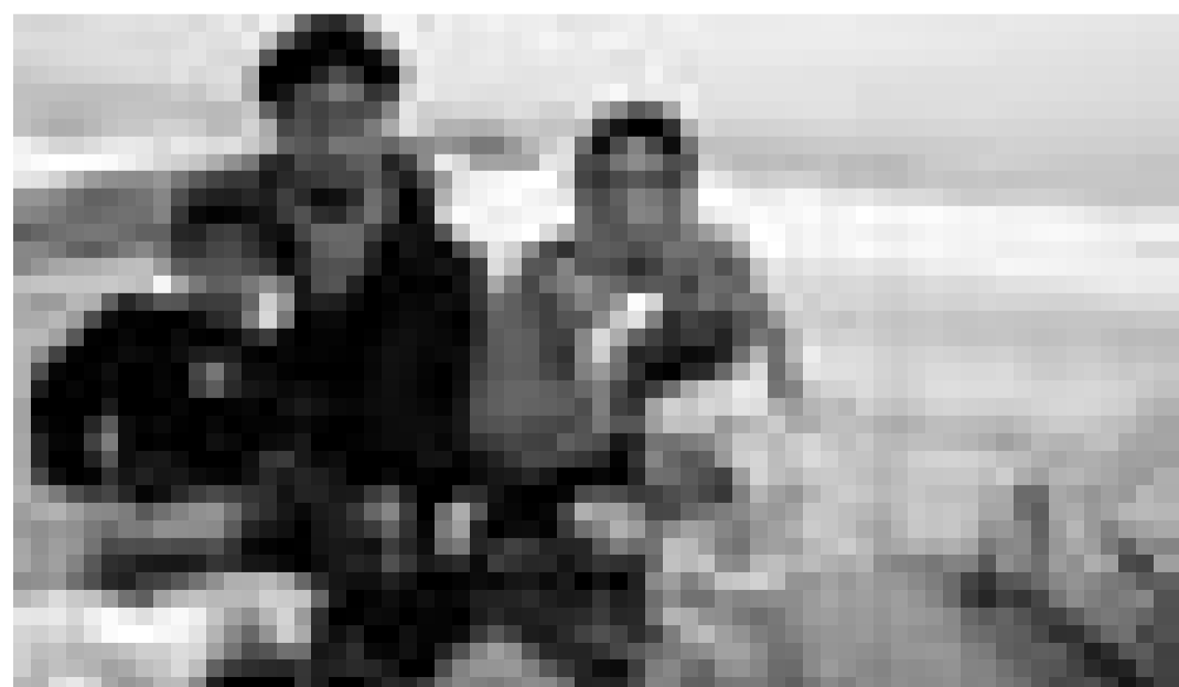
Kühler als in Indien ... "The Namesake" von Mira Nair. Neu im Utopia.