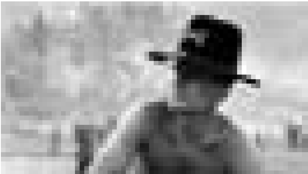
En pleine guerre du Viêt-nam ... Robert Duvall dans "Apocalypse Now" de Francis Ford Coppola. Dimanche à la Cinémathèque.

L'affrontement d'un braqueur et d'un flic. "Heat" renoue avec la tradition des grands thrillers américains, et de la plus brillante façon, en proposant la première rencontre, très attendue, des deux "monstres sacrés" du genre.