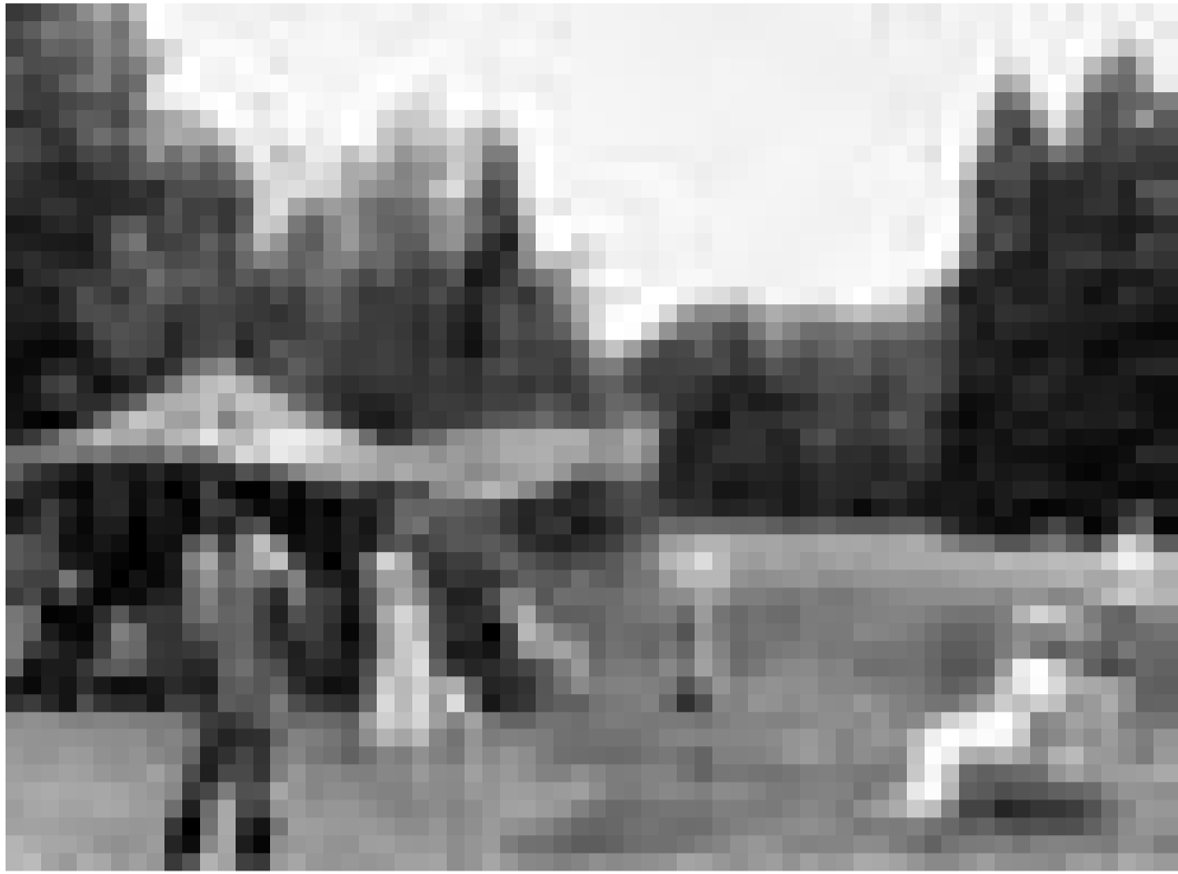
La cerisaie est en fleurs mais les finances sont au plus bas. Le Ciné-Club hellénique présente "The Cherry Orchard" de Michael Cacoyannis, d'après Anton Tchekhov. Mardi et mercredi à l'Utopia.