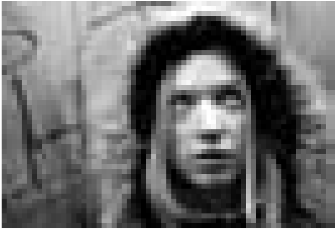
Peur des retrouvailles ... Kate Dickie dans "Red Road" de Andrea Arnold. Nouveau à l'Utopia.